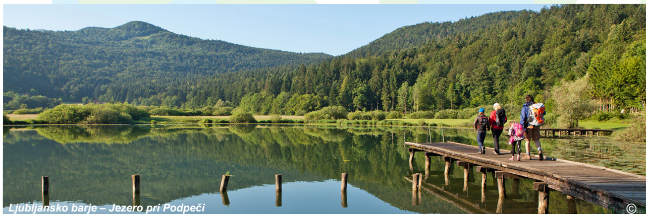
Ljubljansko barje – Jezero pri Podpeči

Mesto Trento (TRENT) je ustvarilo bazo podatkov, ki jih bodo uporabili pri nadaljnjih projektih in raziskavah s področja zelene komunikacije in izobraževanja. Spomladi 2020 bodo za deset osnovnih in srednjih šol organizirali vrsto laboratorijev, poimenovanih "urbani gozdički", ki se bodo odvijali v parkih. Pri tem bodo uporabili igralne karte, ki so jih razvili in natisnili v okviru pilotnega projekta LOS_DAMA!. Podatkovno bazo bodo uporabili tudi za organizacijo vzdrževalnih del na obstoječih sprehajalnih poteh. Za več izmenjav in sodelovanja med sodelavci v upravi in prebivalci bodo izboljšali notranjo in zunanjo komunikacijo.