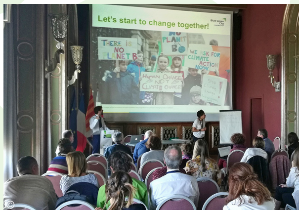
BLUE GREEN CITY, uvodno srečanje, 24.-25. september 2019, Nica, Francija

Cilj projekta je promocija zelene in modre infrastrukture kot neločljivega dela strategij ohranjanja lokalne/regionalne naravne dediščine. Z dogodki, kot so delavnice in usposabljanja, bodo partnerji projekta ciljne skupine ozaveščali o konceptu ekosistemskih storitev in zeleno-modre infrastrukture. Regija Piemont je predstavila rezultate projekta LOS_DAMA! na uvodnem srečanju septembra 2019 v Nici v Franciji. Gostitelj dogodka je bil partner Metropolis Nice Côte d'Azur – Euromed Cities Network (več informacij na: https://www.interregeurope.eu/bluegreencity/ ).